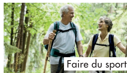
Faire du sport