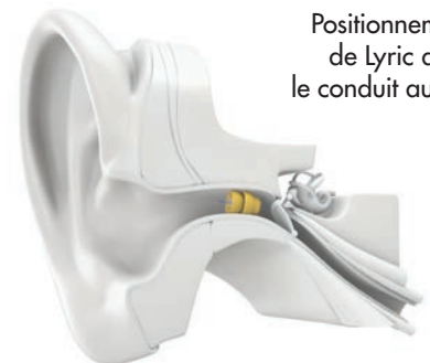
Positionnement de Lyric dans le conduit auditif

Lyric offre un son clair, naturel, non traité et fonctionne en synergie avec l'anatomie de votre oreille de par son positionnement à proximité du tympan. Il utilise votre oreille externe pour diriger naturellement le son dans votre conduit auditif. Il capte ainsi les sons naturels et les rend simplement plus audibles, de façon tout à fait naturelle.