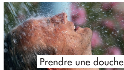
Prendre une douche